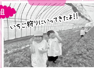
いちご狩りにいってきたよ!!