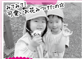
みてみて! 可愛いお花みつけたの女