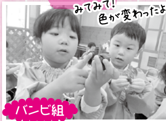
みてみて! 色が変わったよ!