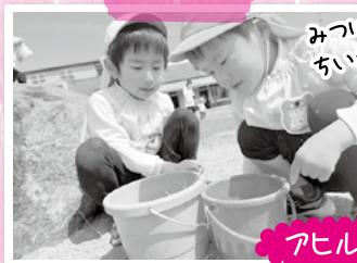
みつけたよ!! ちいさなアリさん