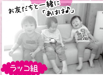
お友だちと一緒に 「あいおほ♪」