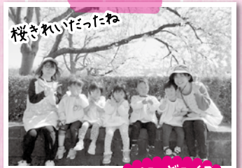
桜きれいだったね