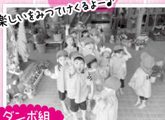
楽しい遊びでけくるよー♪