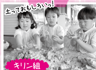
土っておもしろい!!